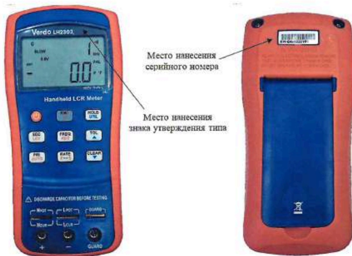
Рисунок 1 – Общий вид приборов и место нанесения серийного номера Пломбирование приборов не предусмотрено.