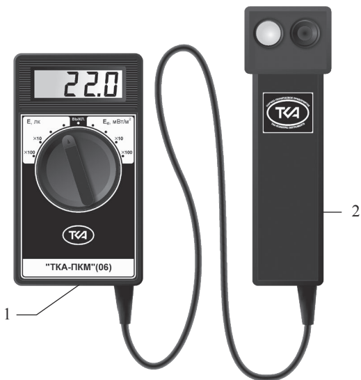
Рис.1 – Внешний вид прибора “TKA-ПКМ”(06) 1 – Блок обработки сигналов 2 – Фотометрическая головка