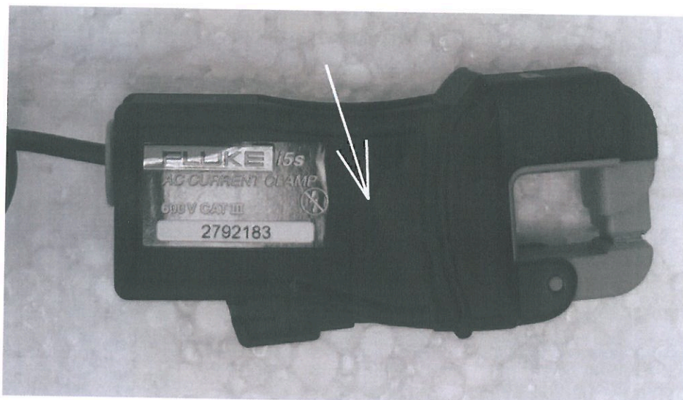
Рисунок 2 - Внешний вид клещей модели Fluke i5s, стрелкой показано место нанесения знака утверждения типа.

Клещи используются для подключения к измерительным устройствам, осуществляющим измерение электрического сигнала на выходе клещей и его дальнейшую математическую обработку с учётом коэффициента преобразования клещей.