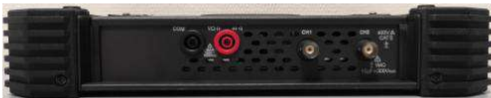
Рисунок 3 – Общий вид осциллографов, верхняя панель двухканальной модификации