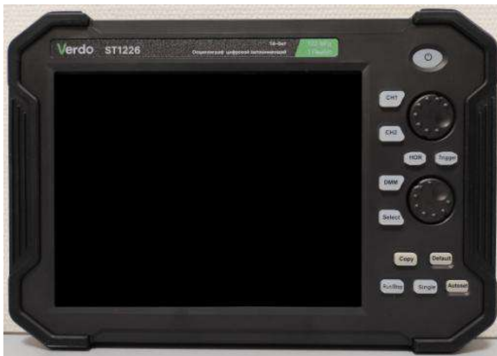
Рисунок 1 – Общий вид осциллографов, передняя панель