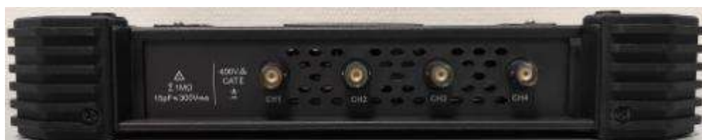
Рисунок 4 – Общий вид осциллографов, верхняя панель четырехканальной модификации