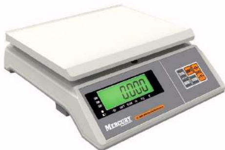
M-ER [X2Z][F]-[Max][d] M-ER [X2Z][L]-[Max][d]

Схема пломбировки от несанкционированного доступа, обозначение места нанесения знака поверки представлены на рисунке 3.