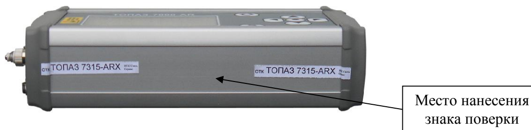
Рисунок 2 - Схема пломбировки тестеров от несанкционированного доступа, обозначение места нанесения знака поверки

Элементы настройки измерительной части тестеров конструктивно защищены. Корпус тестера опломбирован снаружи сбоку пломбой в виде наклейки, которая имеет разрушаемый слой, и при попытке несанкционированного вскрытия повреждается. Схема пломбировки тестеров от несанкционированного доступа, обозначение места нанесения знака поверки приведены на рисунке 2.