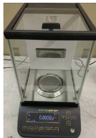
Общий вид модификаций ВЛА-xxx, ВЛА-xxxС, ВЛА-xxxС-О