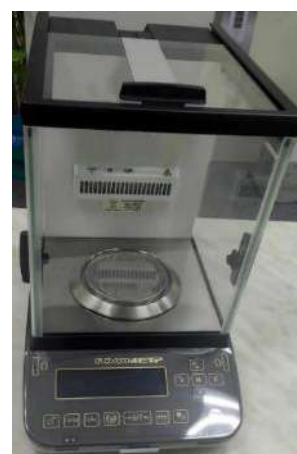
Общий вид модификаций ВЛА-220С-ОА, ВЛА-320С-ОА (исполнение с автоматизированной витриной)