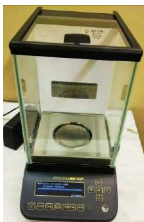
Общий вид модификации ВЛА-xxxМ