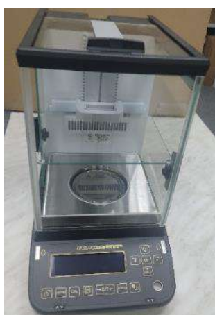
Общий вид модификации ВЛА-xxxМА (исполнение с автоматизированной витриной и регулируемым по высоте внутренним ветрозащитным экраном)