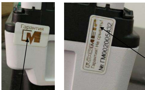
Схема пломбирования контрольными этикетками